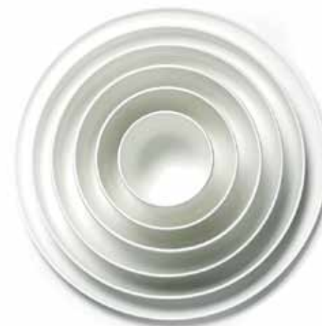
Base by Piet Boon

You have worked in partnership with leading companies from different fields, Land Rover, NLXL, Moooi, Formani and others. What element makes your work so diverse?