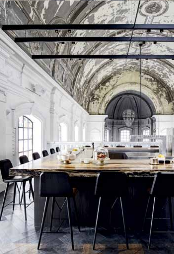
Restaurant "The Jane" Antwerp

Λαμβάνοντας υπόψη το εστιατόριο «The Jane», στο οποίο μεταμορφώσατε πολύ όμορφα ένα πρώην νοσοκομειακό παρεκκλήσι, θα λέγατε ότι η πρόκληση αποτελεί ένα αναγκαίο συστατικό του προοδευτικού σχεδιασμού;