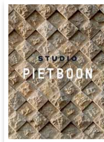
The Studio Piet Boon Inspiration Book

Η φιλοσοφία μας είναι εφαρμόσιμη σε οποιοδήποτε προϊόν και βιομηχανία. Έτσι, μπορούμε να συνεργαστούμε με διάφορους ομοϊδεάτες εταιρους, εξειδικευμένους στον τομέα της δουλειάς τους. Αυτό που κάνει τα πάντα τόσο ποικιλόμορφα είναι πως ταξιδεύοντας σε όλο τον κόσμο γνωρίζουμε καινούριους ανθρώπους και βιώνουμε νέες εμπειρίες σχεδόν κάθε μέρα. Δεν μπορώ να πω τίποτα περισσότερο από το ότι νιώθω πως έχουμε το καλύτερο επάγγελμα στον κόσμο.