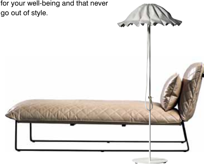
KEKKE, Daybed - LUDE, Floor Lamp

Thank you for noticing. This is exactly what we try to achieve in all our designs. Whether designing for a private, commercial or corporate client, we base our designs on our philosophy or balancing functionality, aesthetics and individuality. This balancing act results in harmony or serenity if you will. We believe that the way someone experiences a space is very important and constantly challenge ourselves to design a pleasant, balanced environment, completely free of dissonance, which creates a sense of calm. Elements, I think, fundamental for your well-being and that never go out of style.