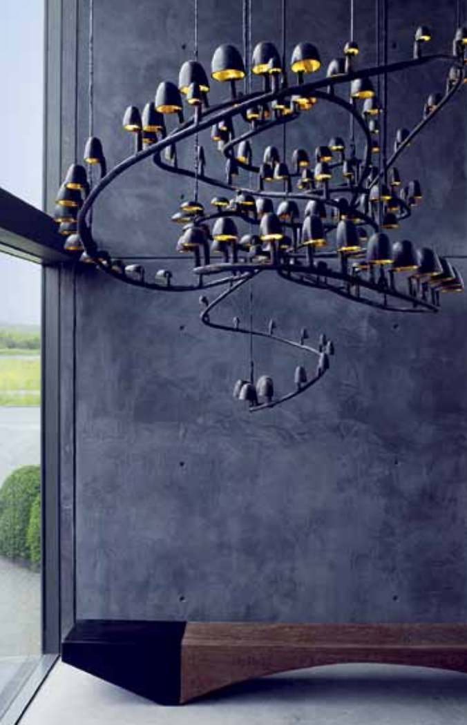
Piet Boon Showroom, Oostzaan