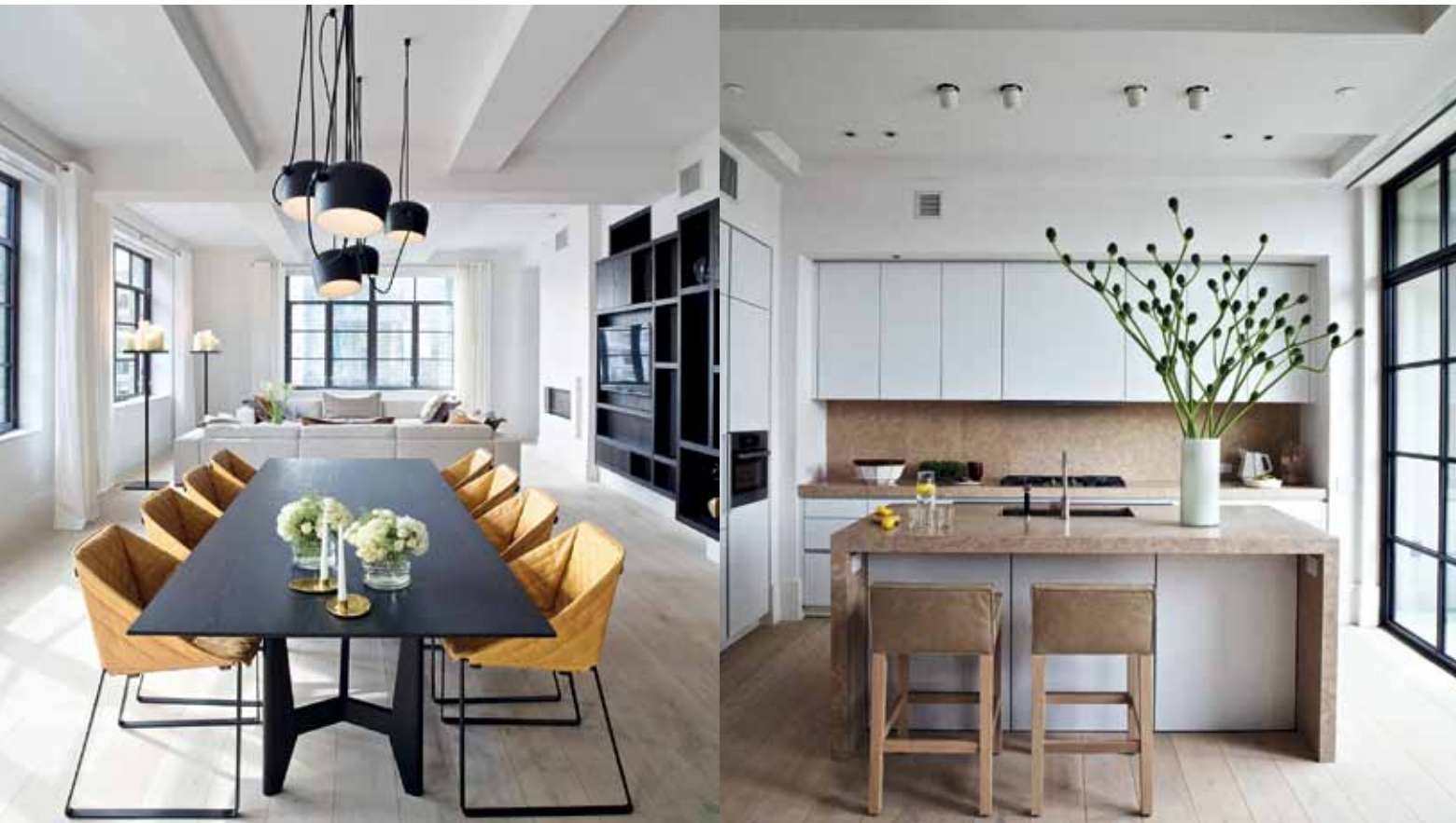
Huys 404, Penthuis

Studio Piet Boon is a Dutch design company because we originate from the Netherlands. Our designs though cannot be labelled as Dutch Design. Dutch Design is internationally known to be minimalistic, funny, experimental and innovative. Something we as a Dutch studio are proud of, but our work does not fit that description exactly. Though we do like to surprise. For more than thirty years we marry functional, timeless design and rich natural materials with distinguishing details. Our work is known and recognizable for how we line spaces, our use and view on dimension and shapes; important in creating balance and harmony, ensuring the same atmosphere and signature throughout. Another hallmark of our style is appreciating the beauty of imperfection and transience.