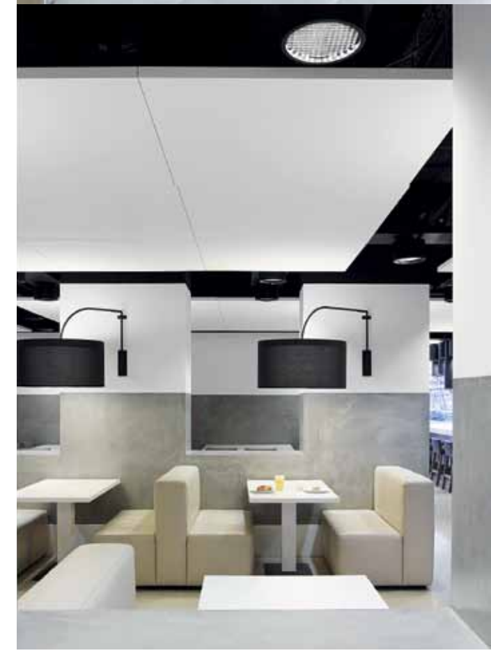
Delta Lloyd Headquarters, Amsterdam