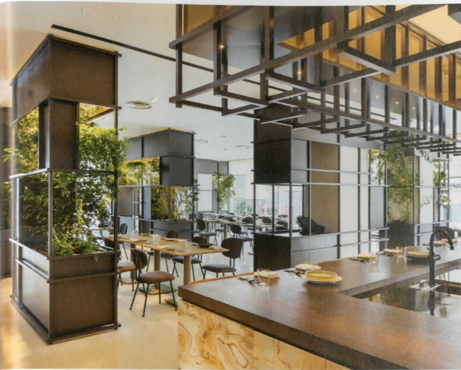
1 2층 레스토랑 '조각보'의 그릴 공간. 2 조각보의 분할된 요소를 모티프로 디자인한 객실. 늦그릇의 색을 키 컬러로 삼았다.