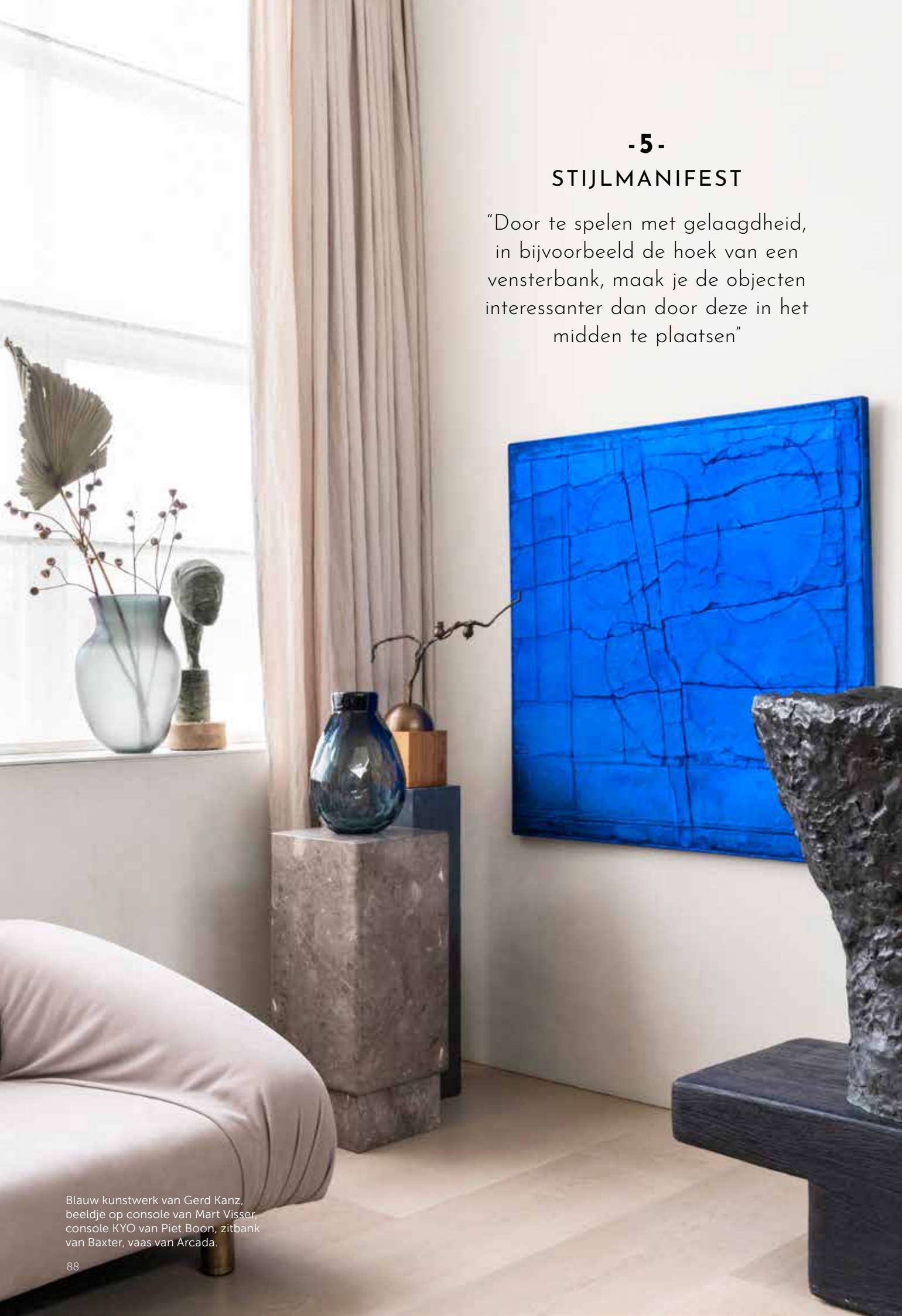
Blauw kunstwerk van Gerd Kanz, beeldje op console van Mart Visser, console KYO van Piet Boon, zitbank van Baxter, vaas van Arcada.

“Door te spelen met gelaagdheid, in bijvoorbeeld de hoek van een vensterbank, maak je de objecten interessanter dan door deze in het midden te plaatsen”