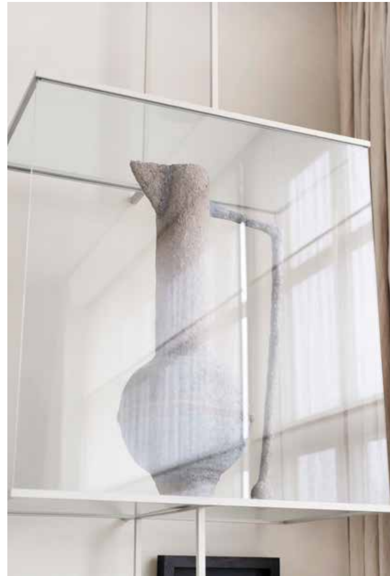
Blauw kunstwerk van Bruno van den Elshout.