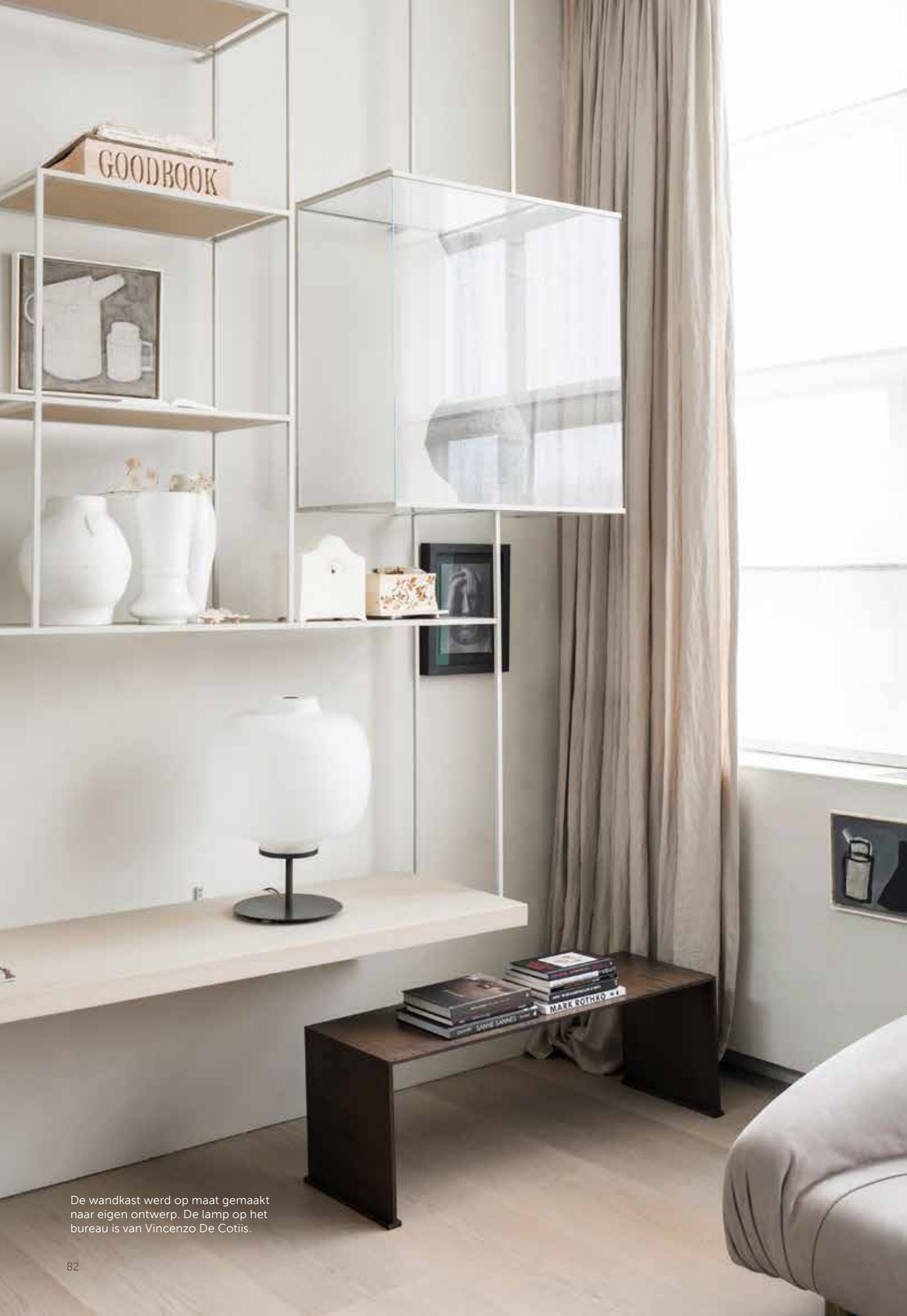
De wandkast werd op maat gemaakt naar eigen ontwerp. De lamp op het bureau is van Vincenzo De Cotiis.