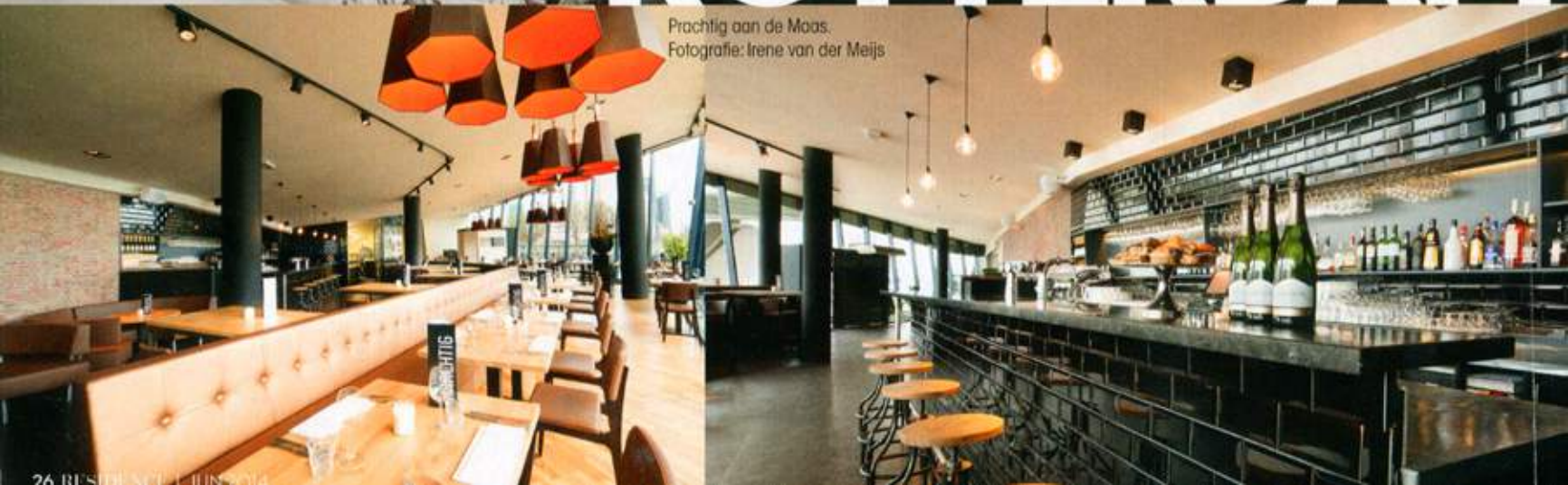
Prachtig aan de Maas.