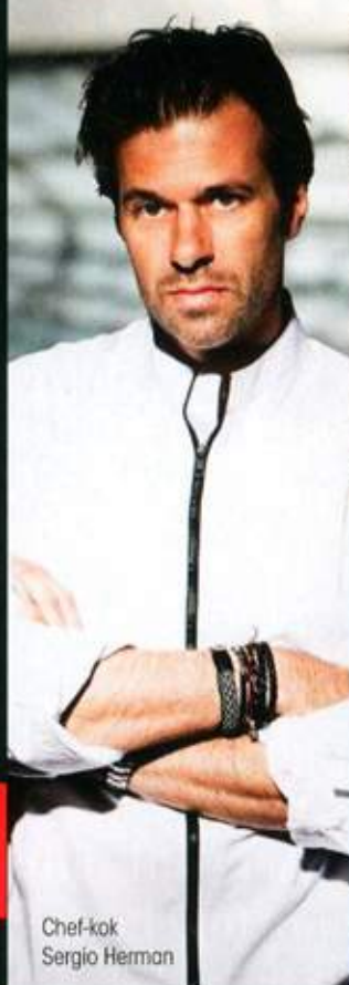
Chef-kok Sergio Herman