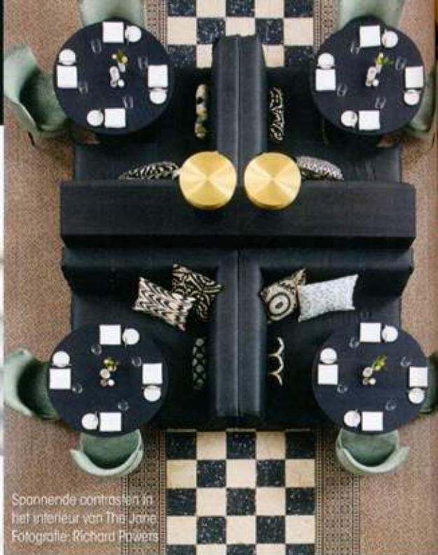
Spannende contrasten in het interieur van The Jane