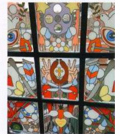
VOOR IEDER KERKRAAM ONTWIERP STUDIO JOB PANELLEN DIE EEN TEGEN-DRADS BEELDVERHAAL VERTELLEN.