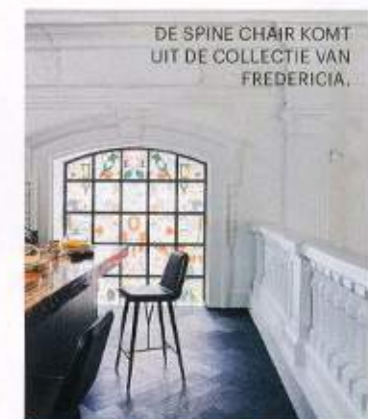
DE SPINE CHAIR KOMT UIT DE COLLECTIE VAN FREDERICA.

The Jane, Paradeplein 1, Antwerpen (0032) 38 08 44 65, www.thejaneantwerp.com