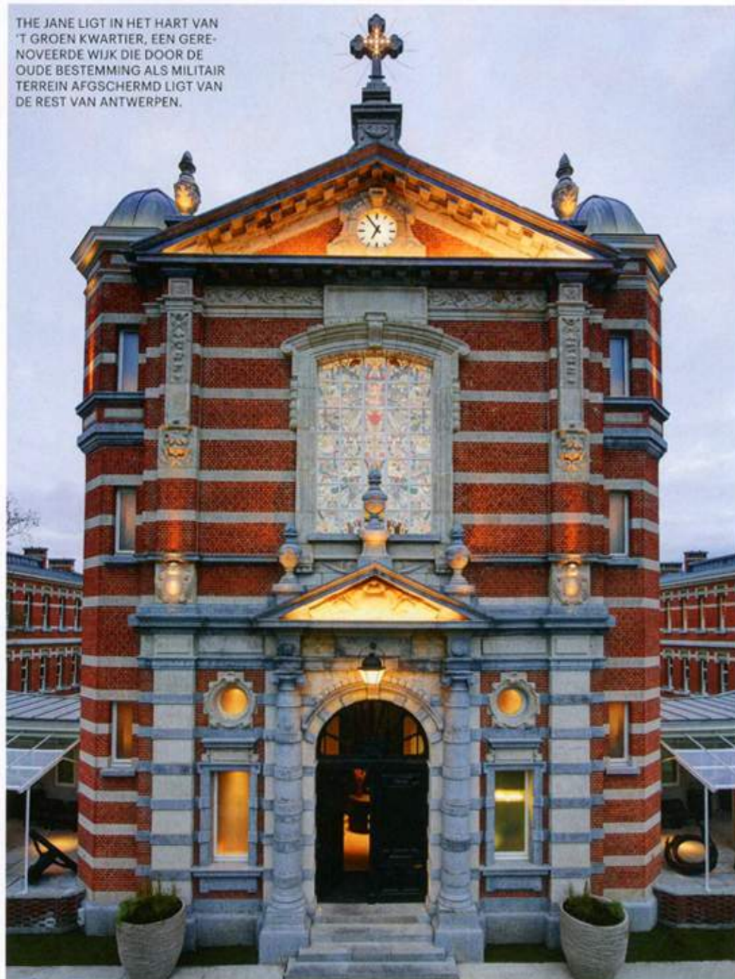
THE JANE LIGT IN HET HART VAN 'T GROEN KWARTIER, EEN GERE-NOVEERDE WIJK DIE DOOR DE OUDE BESTEMMING ALS MILITAIR TERREIN AFGSCHERMD LIGT VAN DE REST VAN ANTWERPEN.