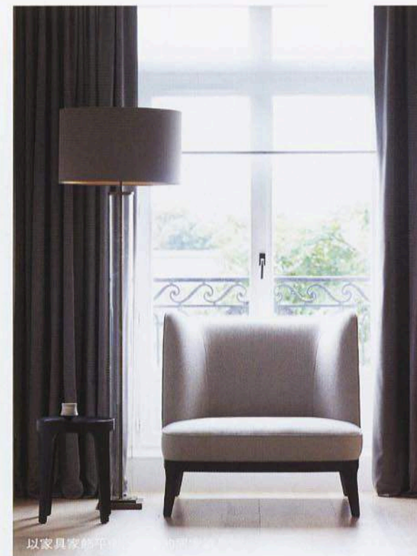
以家具家的平常生活為靈感。