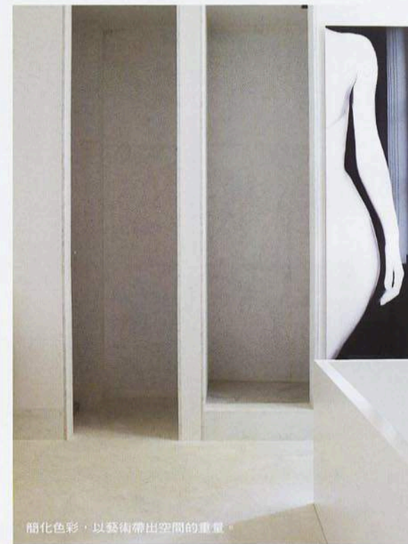
簡化色彩，以藝術帶出空間的重量。