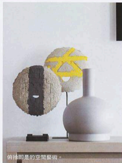
俯拾即是空間藝術。