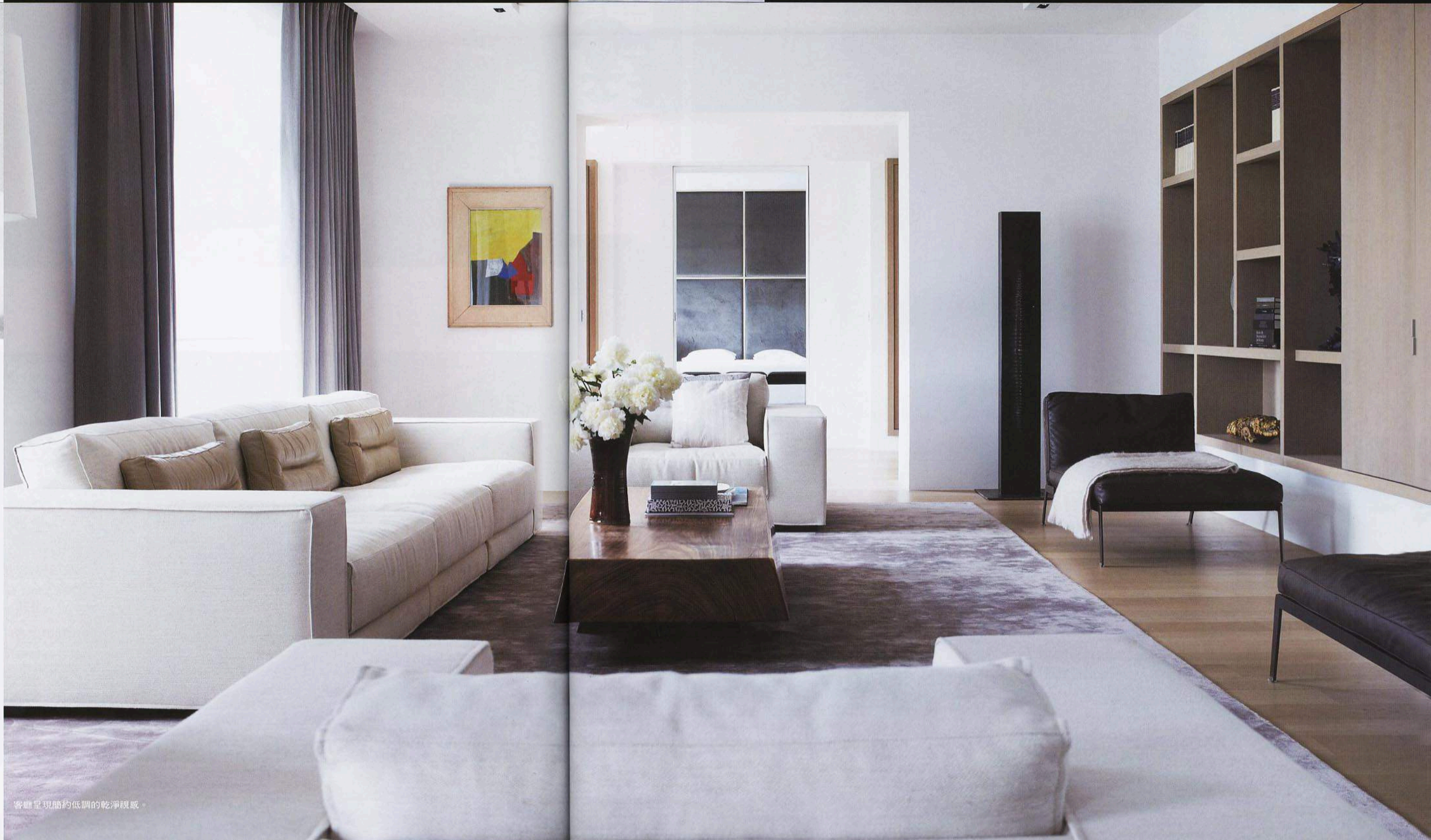
客廳呈現簡約低調的乾淨視感。

從建築版圖擴展到自創家具品牌的設計師、多本著作的作家，Piet Boon 與一般設計豪宅的設計師不同，他與妻子特別愛好自然材質與柔和溫暖的色系，空間中沒有太多華麗的贅飾，而是呈現乾淨、簡約的純淨視感，重視舒適與空間的細節，傳遞出低調的奢華，充滿內斂的美學品味，因此也深受荷蘭王室的青睞。