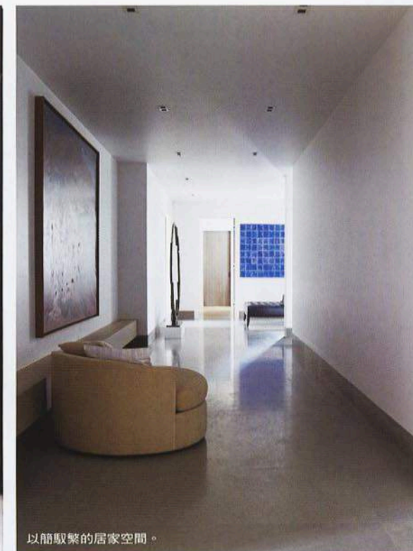
以簡潔的居家空間。