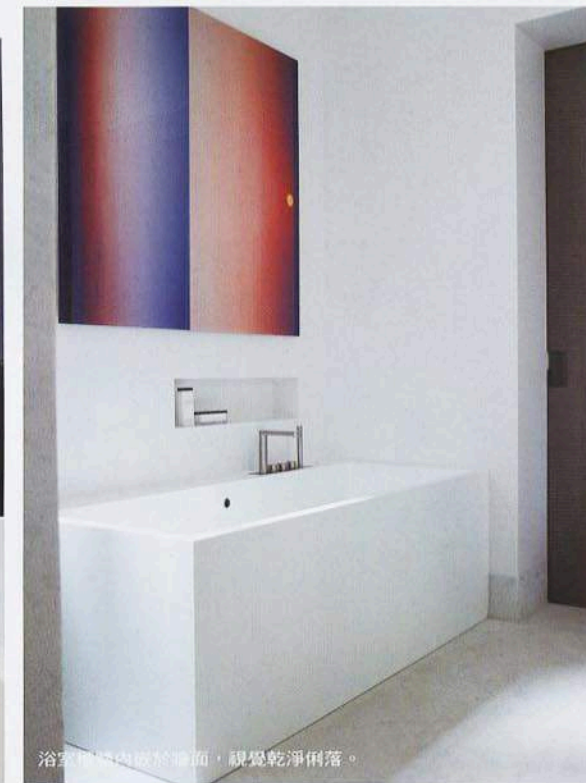
浴室採內嵌於牆面，視覺乾淨俐落。

位於巴黎的本案，是兩戶公寓合併成一戶的設計案例，透過一個低調的門戶相互串連，讓空間巧妙的融合一起，進而創造出截然不同的生活空間，體驗新的設計思維。業主一家的居住成員為夫妻與三名小孩，主要對空間的需求是希望能兼具功能性與空間美感：「一個恆久經典而且精緻的設計，適合正式場合與日常生活所需。」以此創造出一個名副其實能夠遠離城市生活繁忙緊湊腳步的避難所，回到家能有全然放鬆的感覺，因此 Piet Boon 發揮其擅長的設計美感，以質樸、原始的柔和色彩，營造出清新舒適的居家氣息。室內空間可見淡雅的設色，Piet Boon 並蒐集了大量色彩分明的藝術品與室內陳設，精心配置於各個空