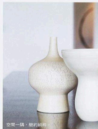
空間一隅，簡約純粹。