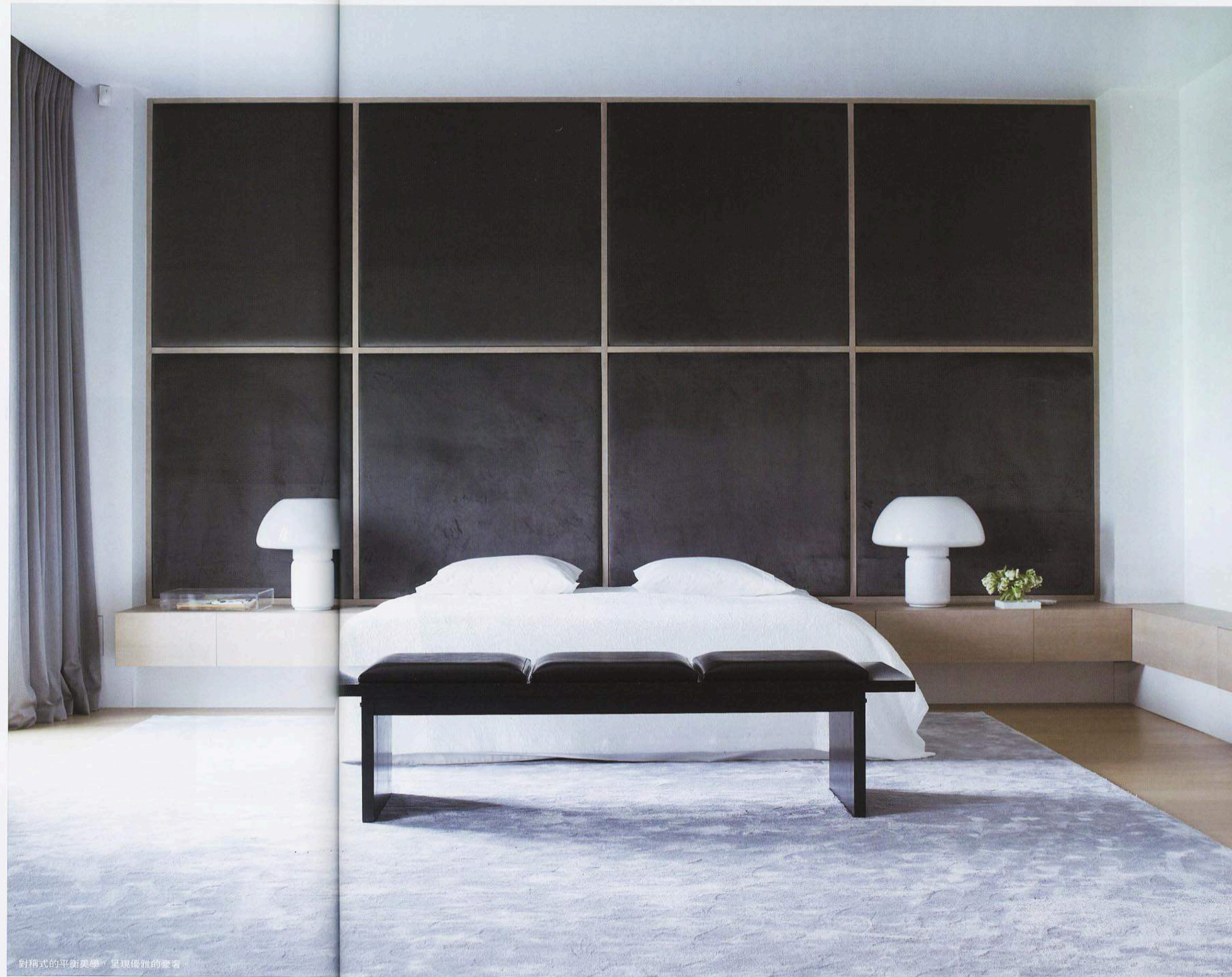
對稱式的平衡美學，呈現優雅的豪華。